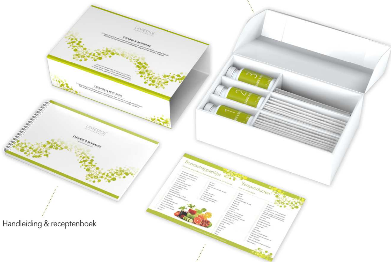
Handleiding & receptenboek

6 ontgiftende, reinigende en ondersteunende voedingssupplementen